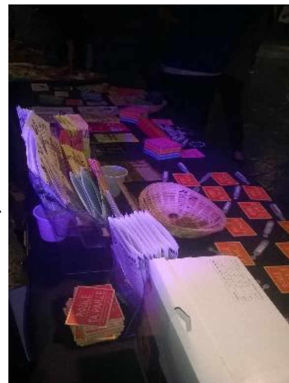
Stand infos et outils de RdR