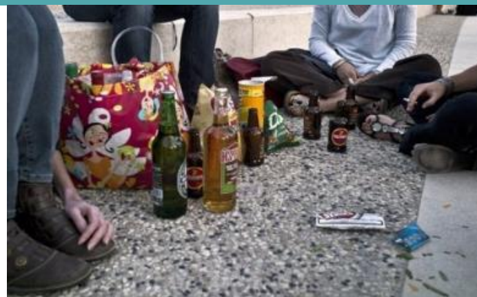
Alcoolisations sur l'espace public