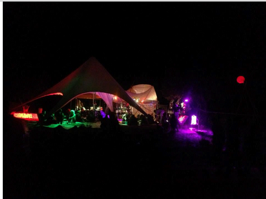
Intervention en free party Var, 2000 personnes, 48h non-stop