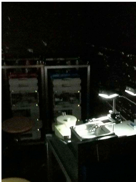
Laboratoire HPLC mobile de Safer Party (Zürich)