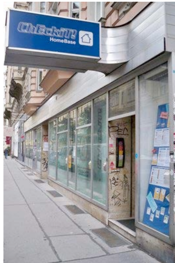
Boutique Check It! : projet municipal de la ville de Vienne